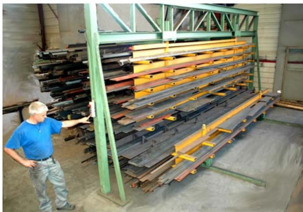
Het gemakkelijk openen- en sluiten van de laden

Het rek bestaat uit 9 laden en 1 bovenzijde die ook gebruikt kan worden voor het opbergen van materiaal. De vakken zijn vrij in te delen. Het is zelfs mogelijk om plaatmateriaal met een max. breedte van ~1700mm in de lade op te bergen!! De minimale vakbreedte bedraagt 50mm. Door de handmatige vergrendeling van de laden is het systeem zeer bedieningsvriendelijk. Een uitgekiend hydraulisch systeem zorgt dat de laden altijd gelijkmatig en geruisloos bewegen. Dit alles maakt dat met 1 man binnen ca. 3 minuten zo'n 500kg materiaal opgeborgen kan worden!!