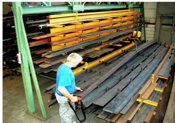
Eenvoudig vullen van het magazijn (in dit geval met een hijsmiddel)