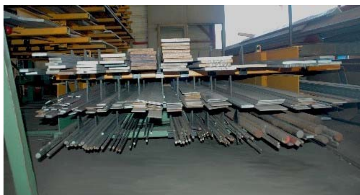
Een blik op de voorzijde van een geopende lade

Heeft u nog vragen, of zou u nog meer van dit product willen zien of horen, neem dan eens contact op, wij staan u graag geheel vrijblijvend te woord.